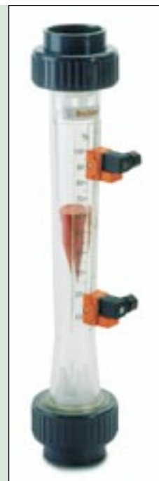
Modell eines Durchflussmessers mit Grenzwertkontakten

Bei diesem Schwebekörper-Durchflussmesser sitzt der feinfühligke Schwebekörper reibungsfrei im Messrohr