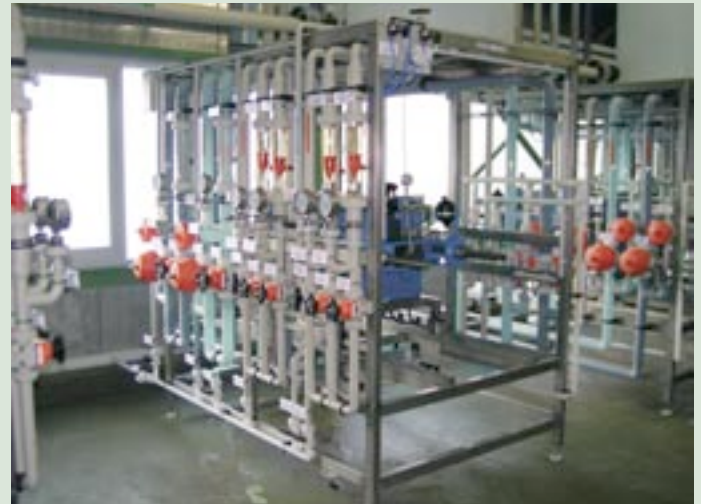
Ausgeklügelte Technik: Elektrodialyse mit monoselektiven Membranen